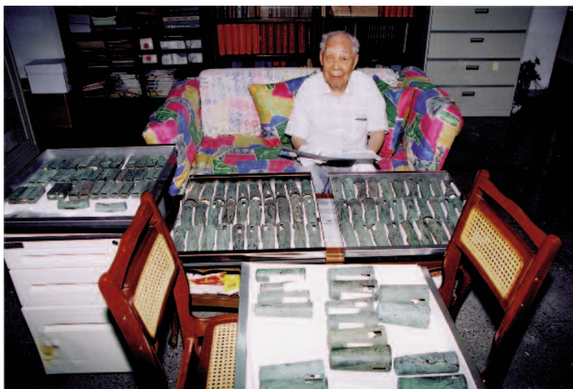
2003 年 6 月 8 日於工作室中，整理西北崗 M1136-1137 車坑出土車器。

1934 年秋—1935 年春，侯家莊西北崗。西區：發掘出四座帶四條墓道的大墓（M1001、M1002、M1003、M1004）。東區：發掘小墓 411 座（多為祭祀坑，包括