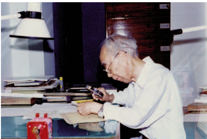
1995年9月30日，於工作室用放大鏡正在審視 HPKM1556。

1935年秋，侯家莊西北崗。西區：發掘出三座帶四條墓道的大墓（M1217、1500、1550），一座未完工的大墓（M1567）殉葬坑。東區：清理出一座帶四條墓道