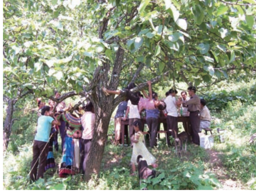
圖二：各依地形，擺設家宴