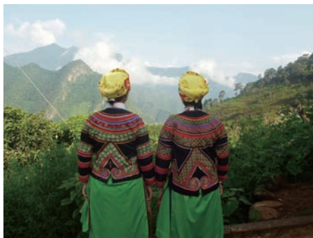
圖十二：「節日盛裝」——吉姆家支裏的彝族姐妹

從本文考察的吉姆家族案例來看，哈里斯與費什勒等的解釋都有道理。在很大程度上可以說生態環境、經濟狀況和營養選擇決定了當地村民的食譜構成；但與此同時，那些用在「祭祀儀式」當中並又在其之後「回到世俗」而被人們食用的雞和豬，尤其是「一去不復」的祭祀之米，卻似乎只能用「思想（信仰）決定食譜」才能理解。