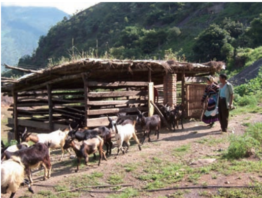
圖三：養羊是山區村民經濟生活的一種補充