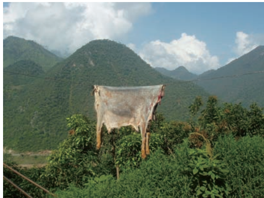
圖四：以羊待客是當地的傳統