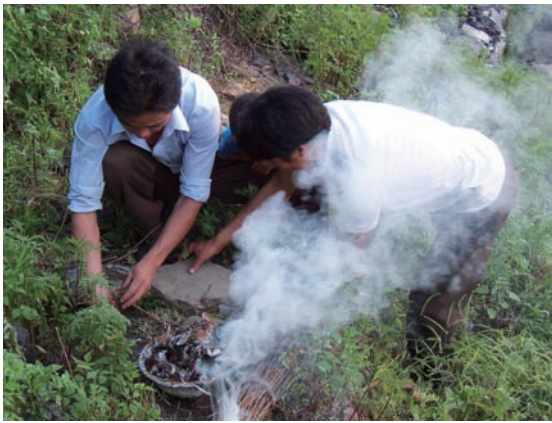
圖八：「山祭」成為火把節的一個部分

火把節的晚上。在山頂的草壩子寨，村民們揮舞火把，沿著田間地頭奔走繞行之後，又回到家中點燃新火，舉到半山坡上，開始另一項特別的儀式：「山祭」（圖八）。與前面活動不同的是，這項儀式不讓婦女參加。男人們蹲到地上，用石塊和樹枝搭建小屋，並在上面擺放雞毛、碎石和米，口中念念有詞一番，接著很快將小屋點燃燒掉。他們解釋說這樣做的意義是爲了向生活在陰間的先輩祭獻禮物。小房是象徵，即代表民居又表示牲圈，體現後輩的緬懷和敬意。（圖九）