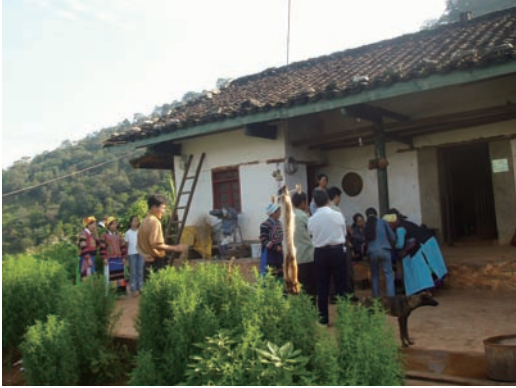
圖一：節日喜慶，款待賓客