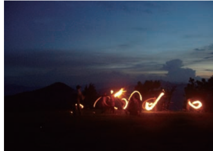
圖七：「狄力火」即點燃火把，驅趕蟲害