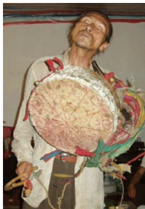
圖十一：進入迷狂狀態的蘇尼

對於外人來說，最大的好奇是，這樣做了之後的效果如何？我們次日便離開當地，直接的結果不得而知。但從吉姆家人的解釋裡知道，同類的法事在以往是靈驗的，不然還有誰信……。