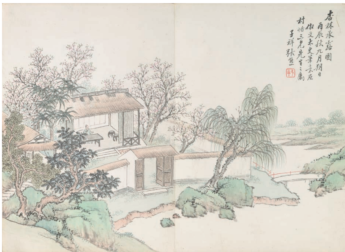
《杏林承露圖》（中央研究院歷史語言研究所傅斯年圖書館典藏）